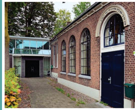
De Dierense Sjoel Spoorstraat 34 6953 BX Dieren